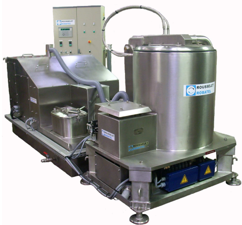
Gamma RC Lav